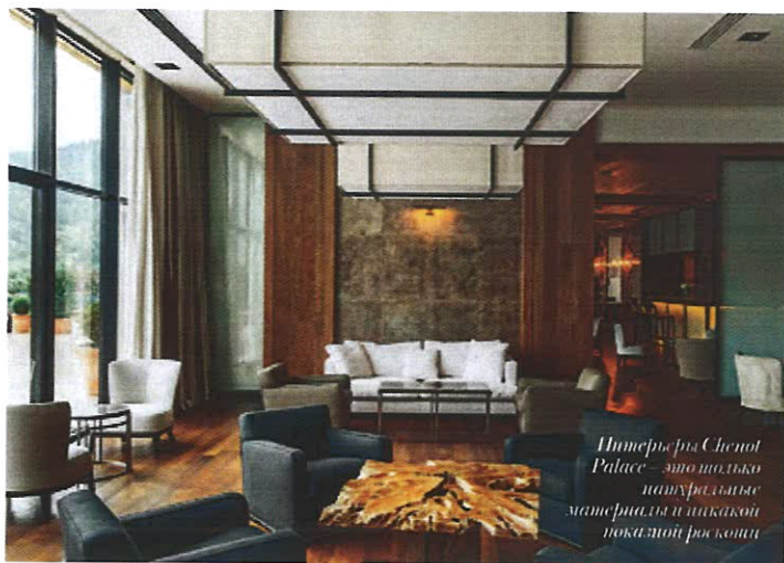
Интерьеры Chenot Palace – это только натуральные материалы и никакой показной роскоши